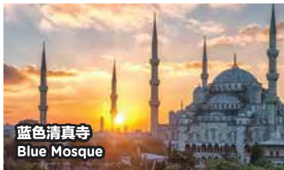
蓝色清真寺 Blue Mosque