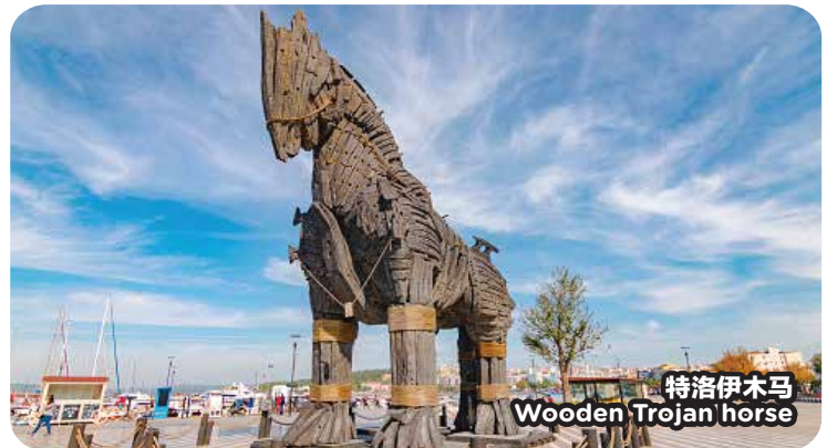
特洛伊木马 Wooden Trojan horse

Arrival Kuala Lumpur with happy memories.