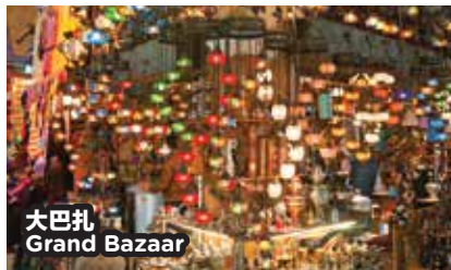
大巴扎 Grand Bazaar