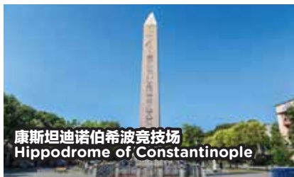
康斯坦迪诺伯希波竞技场 Hippodrome of Constantinople