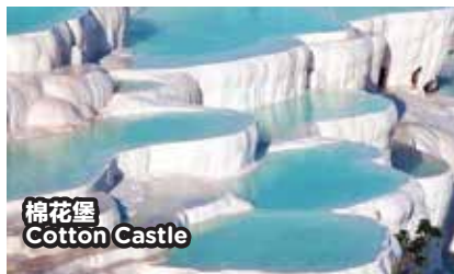
棉花堡 Cotton Castle