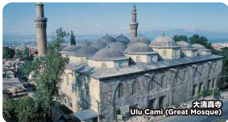
大清真寺 Ulu Cami (Great Mosque)