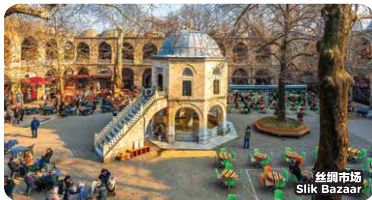
丝绸市场 Silk Bazaar

· 倘若原定的景点不对外开放，将由其他景点取代。 · 以上的景点先后顺序可根据具体的情况有所调整。 · 在主要节日，商业展览，旅游旺季期间，住宿酒店可能需要安排在另一个城市。